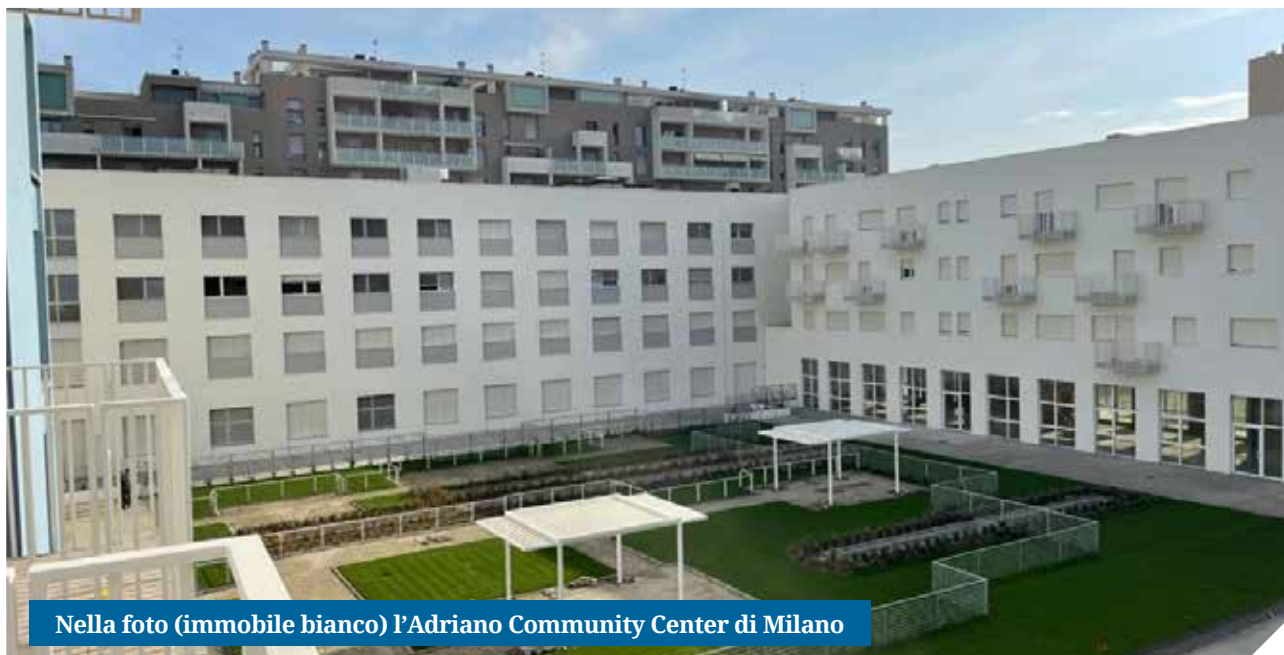
Nella foto (immobile bianco) l'Adriano Community Center di Milano

Gli incontri proseguiranno anche nel 2022 con un primo approfondimento sugli esiti della legge di bilancio e le connessioni con il PNRR.